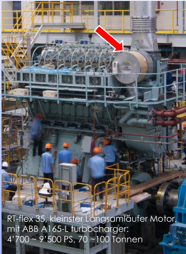
RT-flex 35, kleinster Langsamläufer Motor, mit ABB A165-L turbocharger: 4'700 ~ 9'500 PS, 70 ~ 100 Tonnen