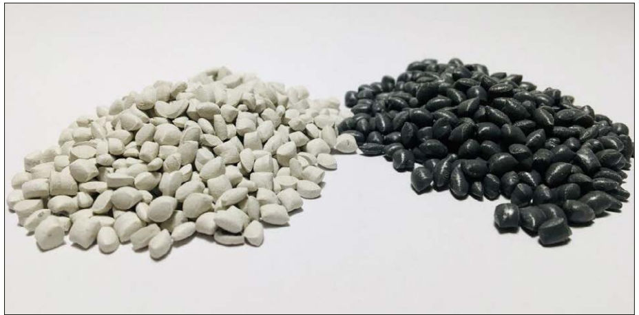
Von iwas-concepts AG entwickeltes Rezyklat in Granulatform

Anschließend werden diese aufbereiteten Abfälle zu einem Hybrid-Rezyklat weiterverarbeitet. Dieses Hybrid-Rezyklat enthält neben GFK-Abfall eine thermoplastische Matrix, welche als Industrie-Rezyklat oder Post-consumer-Rezyklat vorliegt. Mittels Compoundierung und unter der Beigabe diverser Additive werden die Ausgangsmaterialien zu einem homogenen Compound und anschliessend zu Granulat verarbeitet. Das IKT hat unterschiedliche Granulat-Formulierungen entwickelt, welche auf das jeweilige Verarbeitungsverfahren optimiert wurden. Die Granulate können auf den gängigen Anlagen der verarbeitenden Industrie, sprich mittels Spritzguss, Extrusion oder Fließpressen, zu unterschiedlichen Produkten verarbeitet werden. Diese Produkte können nach ihrem End-of-Life wiederum zu 100% zu Granulat aufbereitet werden, wodurch der Wertstoffkreislauf geschlossen werden kann. Die technische Machbarkeit der entwickelten Lösung wur-