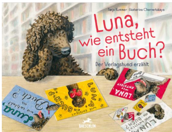
© Tanja Kummer & Ekaterina Chernetskaya, Baeschlin Verlag (2022)