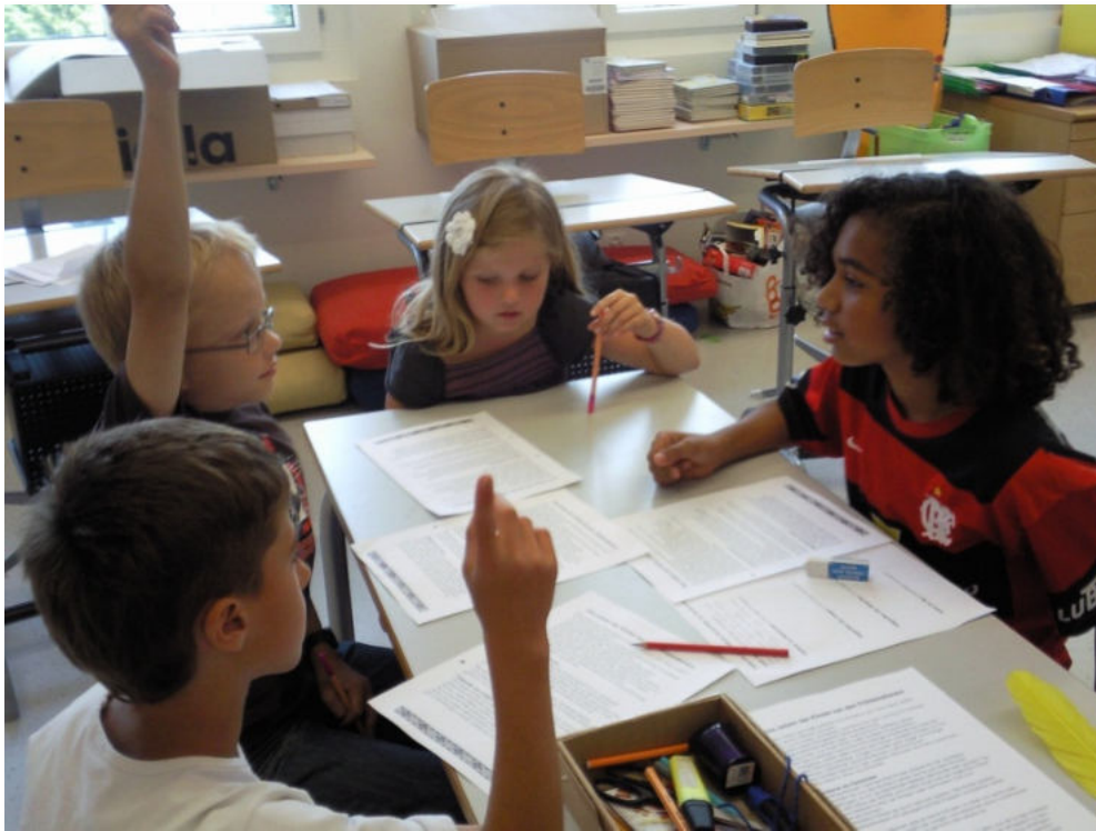
„Lernen durch Lehren“

Verschmelzung von fachlichen und überfachlichen Kompetenzen ist gefragt