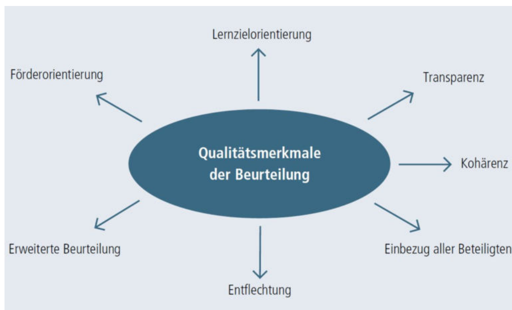
aus: fördern und fordern, Kanton Solothurn, S. 11

Nicht alle im neuen Lehrplan aufgeführten Kompetenzen und Kompetenzstufen müssen beurteilt werden. Wie bisher gehört es zur Professionalität der Lehrpersonen, zu überlegen, wann und mit welchen Mitteln sie Leistungen der Schülerinnen und Schüler einschätzen und beurteilen.