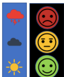
Abbildung 1 Hehn-Oldiges

In Klassen- oder Gruppenräumen finden sich häufig an Ampeln oder Wetterkarten orientierte Ermahnungsskalen (s. Abb. 1), Strichlisten (Abb. 2) oder Verstärkersysteme, bei denen Tokens in Form von Sternchen, Punkten oder Smiley-Symbolen für erwünschtes Verhalten (grüner, lächelnder Smiley) oder unerwünschtes Verhalten (roter, besorgter Smiley) abgebildet und gesammelt werden (s. Abb. 3).