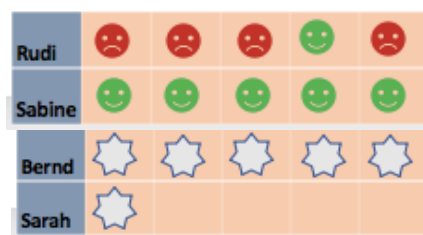
Abbildung 3 Hehn-Oldiges

Ampeln können drei- bis mehrfarbig sein. Klassisch ist die Anordnung grün - gelb - rot, es gibt jedoch Erweiterungen, wie grün – gelb – orange - rot - schwarz. Häufig sind sie mit Smileys versehen, die fröhlich, neutral oder besorgt schauen, um den Farben noch Nachdruck zu verleihen. Auch die Wetterkarte kann weitere Zwischenstufen beinhalten.