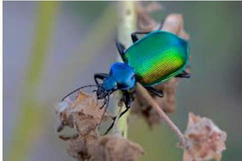
Name: Grosser Puppenräuber