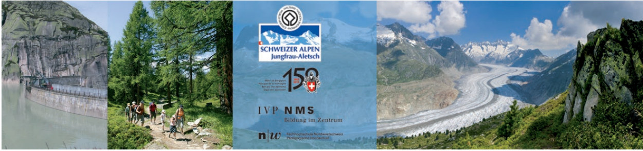
Ein Projekt des UNESCO Welterbe Schweizer Alpen-Jungfrau-Aletsch in Partnerschaft mit dem Schweizer Alpen-Club SAC, dem IVP NMS (PH Bern) und der PH FHNW